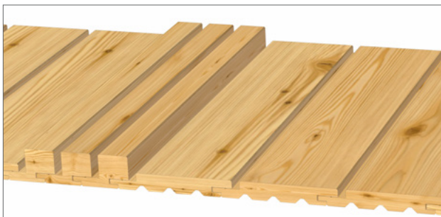
Gestaltungsvorschlag 1: 3x 40x68 mm, 3x 21x146 mm