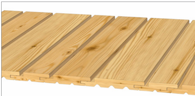
Gestaltungsvorschlag 2: 1x 21x96 mm, 1x 21x121 mm, 1x 21x146 mm