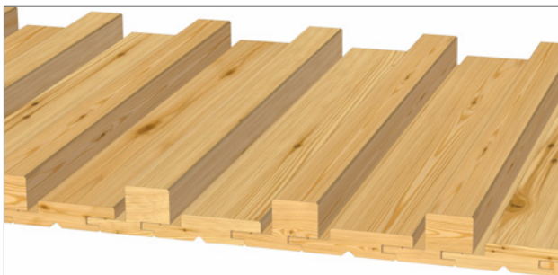
Gestaltungsvorschlag 3: 1x 21x96 mm, 1x 40x68 mm